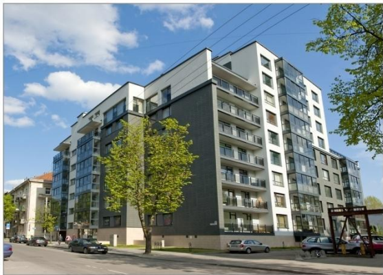
„Vivulskio namai“, Eika

Renovavome ir pastatėme daugiau nei 1000 butų bei daugiau nei 50.000 kv. m. komercinio ploto. Keli naujai statytų projektų pavyzdžiai: