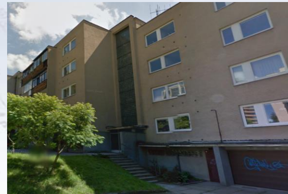
Žirgo g. 5, Vilnius

20 butų. Atnaujinta el. skydinė ir paskirstymo skydai aukštuose.