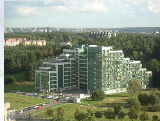
„Prie parko“, Imobiliar

282 butai ir požeminis parkingas, gatvės apšvietimas. Sėkmingai optimizavome projektą, buvome pagrindinis elektros ir silpnų srovių rangovas.