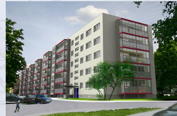
Žirmūnų g. 102, Vilnius

24 butai. Atnaujinta el. skydinė ir paskirstymo skydai aukštuose.