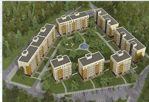
„Gudelių šilas“, Hanner

71 butas ir požeminis parkingas. Buvome pagrindinis elektros ir silpnų srovių rangovas.