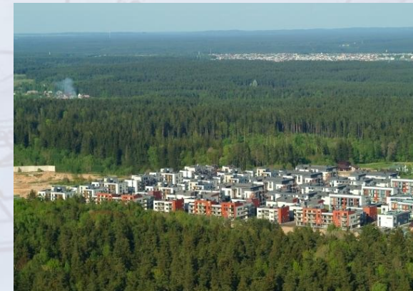
„Santariškių namai“, Eika

185 butai ir požeminis parkingas. Buvome pagrindinis elektros, gaisrinės ir vėdinimo automatikos, silpnų srovių rangovas.