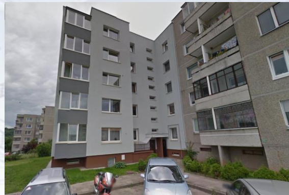
Šviesos g. 14, Grigaiškės

20 butų. Atnaujinta el. skydinė ir paskirstymo skydai aukštuose.